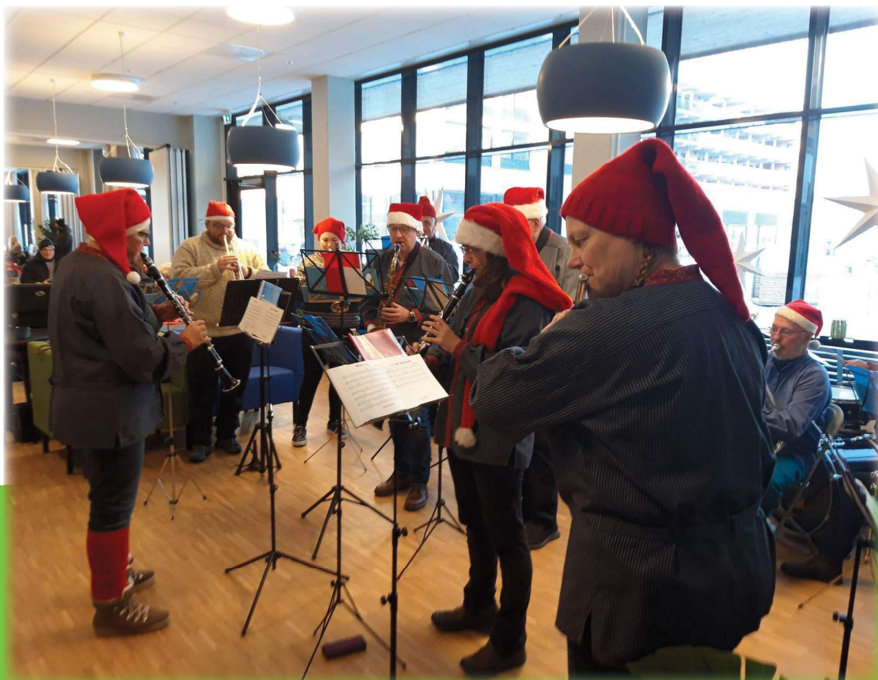
Nissekorpset på Julemarkedet - LHOS

I desember arrangert vi julemarked på Harestua torg og LHOS. Det var ca. 30 utstillere. Honning, kaker, brukt, strikkede, sydd og mye mer. Et ukrainsk kor som sang, nisse og nissehest på besøk. Sanitetsforeningene sto for salg av kaffe og vafler i kafeterian. Hadeland Janitsjar spilte i cafeen og i 2. etage. Dagen ble veldig vellykket med mange besøkende både fra omsorgsenteret og lokalmiljøet. Selv om gradestokken krøp ned mot -20. En litt kald dag for nissen, som samlet inn ønskelister.