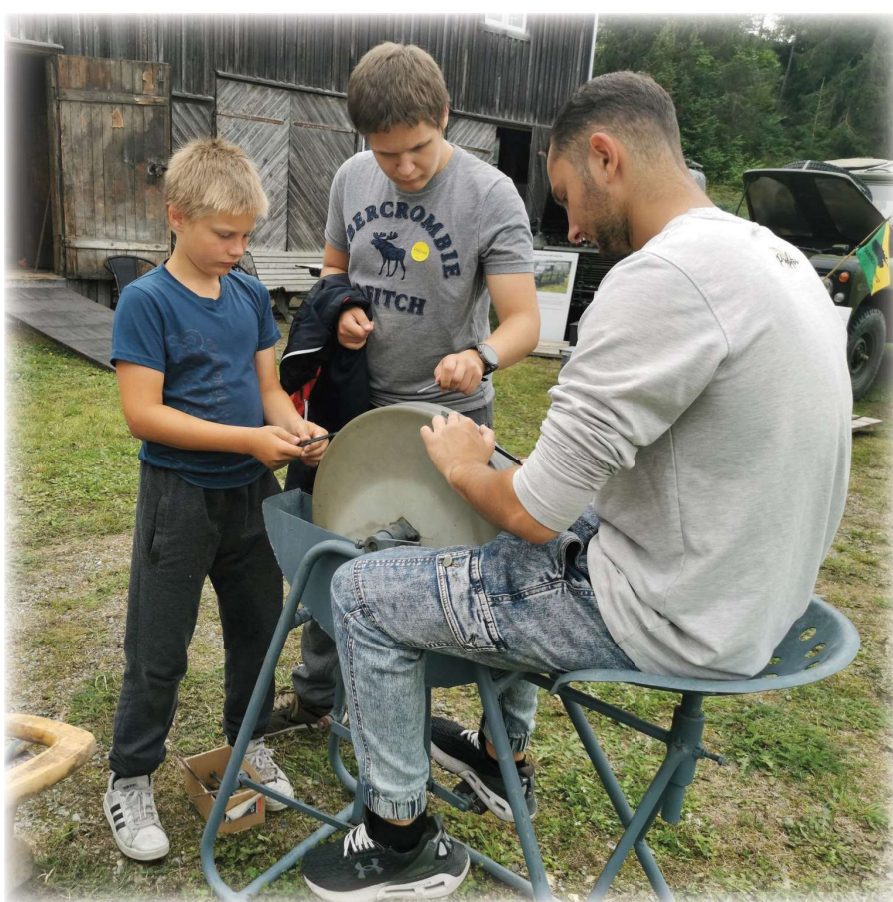
Flerkulturell - besøk på Folkemuseet