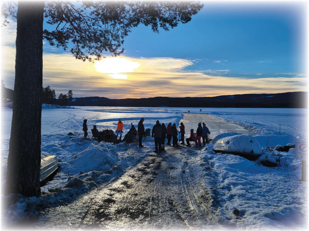
Bålkos på isen - Harestua