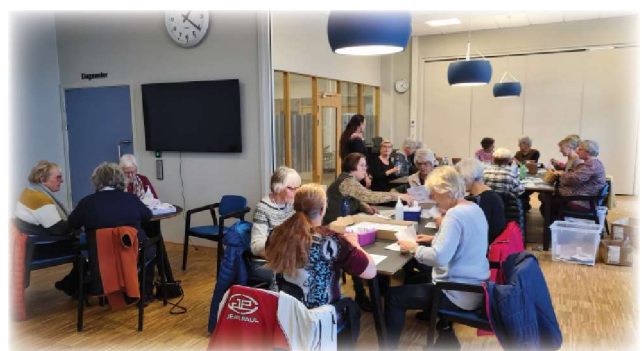
Sanitetsdamer pakker corona tester i kafeen på LHOS

Det var en stor oppsving av uteaktivitet med store ansamlinger av veldig unge ungdommer på vårparten. Det ble uttrykket ønske om at Natteravner skulle på banen igjen, etter mange år uten oppdrag. Det ble etablert en liten gruppe med frivillige som var ute og vandret en kveld før sommerferien. Situasjonen ble roligere og Nattevandringen lagt på is til våren 2023. Vi vil følge med på behovet ut over våren, og eventuelt starte opp igjen vandringen.