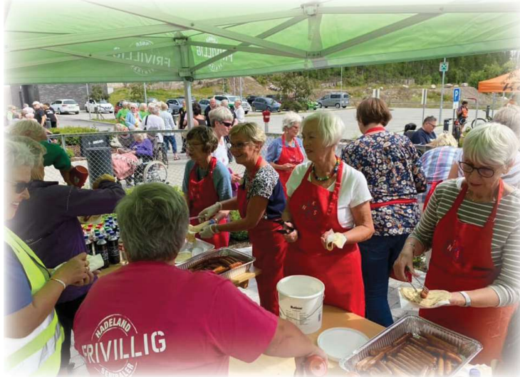
Servering under den store sykkelturen