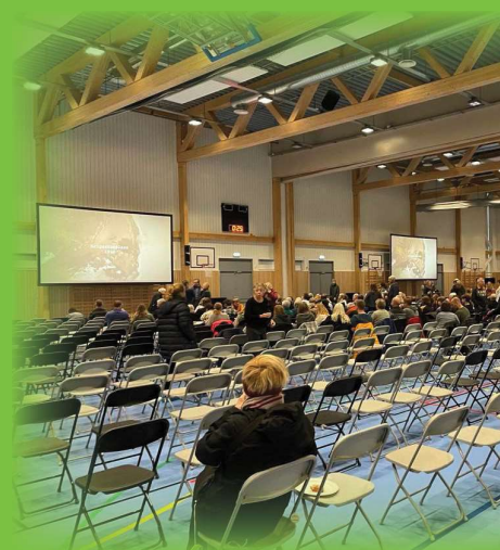
Ungdom i sving under filmfremvisningen av invasjonen i Harestua Arena