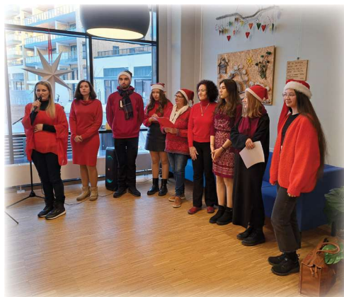
Ukrainsk nissekor, julemarkedet - LHOS