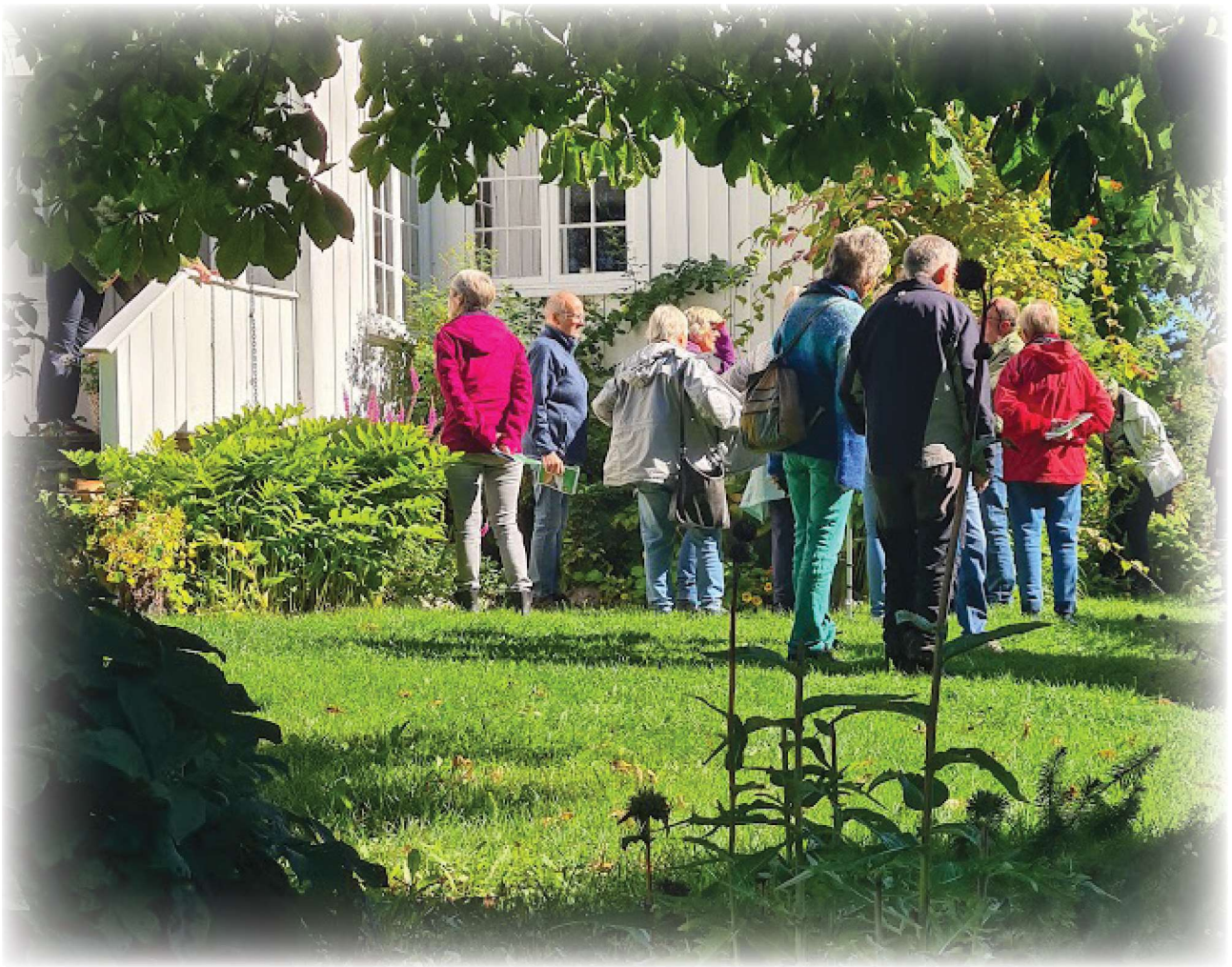
Café Bergo - Hagevandring i Kjørvenhagen på Lunner