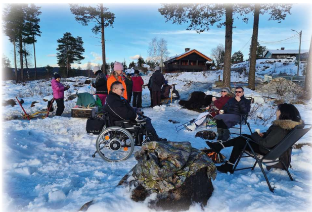
Kos på Harestuvannet med Tunet

I november bidro frivilligsentralene med organiseringen rundt fremvisningen av filmen Invasjonen på Harestua, på Harestua Arena Her rigget vi stoler og sto for servering til 700 kinogjester.