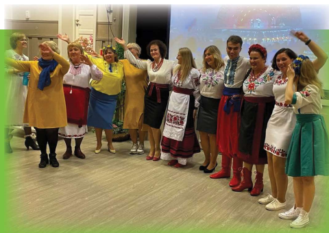
Ukrainsk aften - Gran