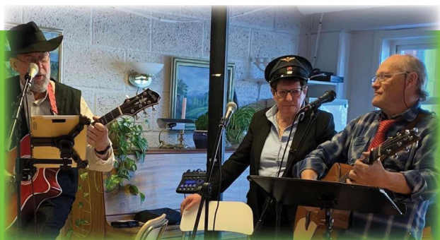
Underholdning på Cafèv Bergo