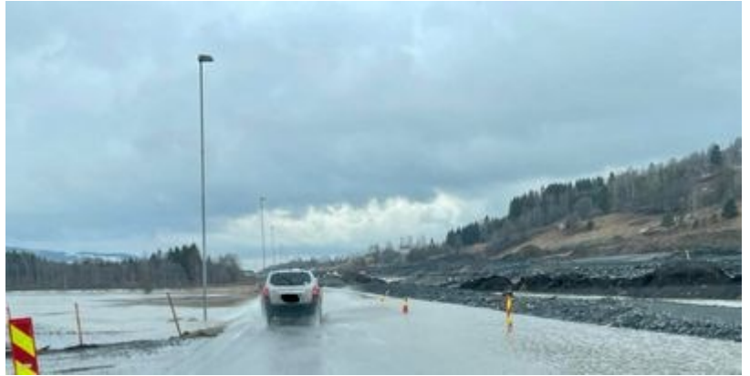
Flom april 2023

I Helhetlig risiko- og sårbarhetsanalyse for Lunner kommune er skog- og utmarksbrann, langvarig strømbortfall og ekstremvær vurdert å ha høyest sannsynlighet. Jernbaneulykke med farlig gods, jordskred, svikt i vannforsyning, stort luftbåret utslipp fra utlandet, langvarig bortfall av strøm og ekstremvær er vurdert å gi størst konsekvenser. Samlet sett er det langvarig bortfall av strøm og ekstremvær som er vurdert å kunne ha høyest risiko. Analysene er gjort ut fra scenarier. Forslag til tiltak ut fra funn i analysene, er innarbeidet i tiltakene i denne planen.