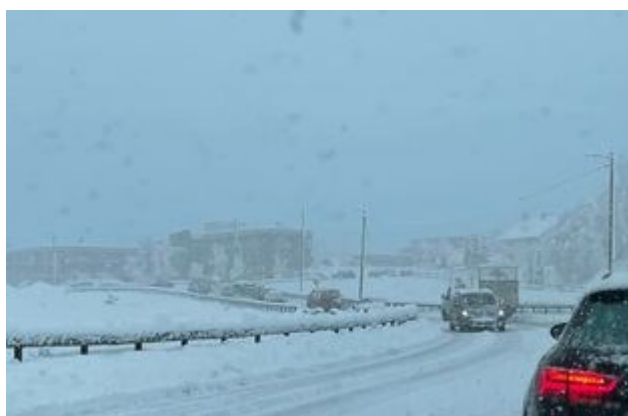
Snøkaos og nedbørsrekord april 2023