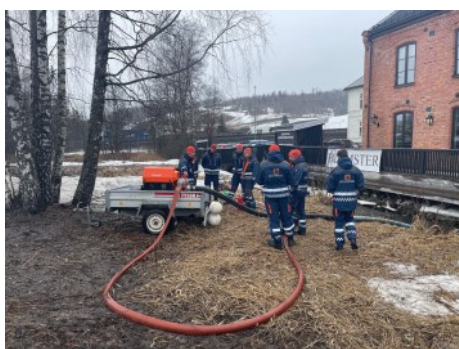
Øvelse sivilforsvaret våren 2023