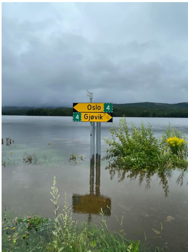
Harestuvannet under ekstremværet «Hans» august 2023