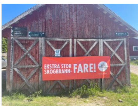
Skogbrannfare sommeren 2023