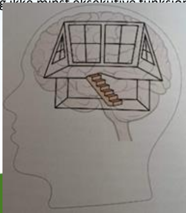
Hjernehuset og hjernetrappen

Allerede i den prenatale perioden starter utviklingen av hjernen seg. Det dannes ett nettverk av nevroner og synapser, som reduseres og økes i løpet av livet. Vi skal se nærmere på denne utviklingen og hvilken betydning det har for læringsprosessene til ett barn. Hjernen sammenliknes ofte som ett hus, med to etasjer og trappa mellom etasjene. «Trappa må gås» gjentatte ganger for at en bevegelse, en handling skal automatiseres. Når handlingen er automatisert, er hjernen klar for ny læring. Denne læringen kan også sees som stier i hjernen og jo bredere en sti er, jo bedre husker barnet informasjonen. Andre faguttrykk vi skal gjøre oss kjent med er blant annet amygdala, hippocampus og ikke minst ekskutive funksjoner.